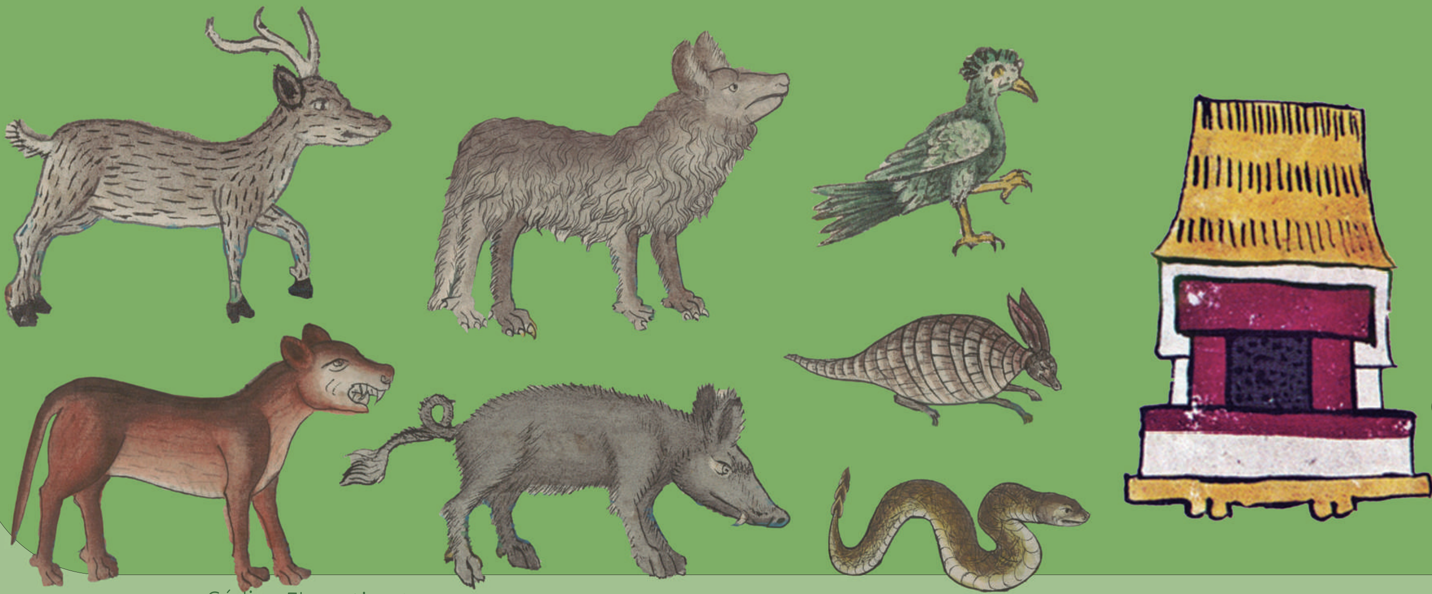
Códice Florentino L. XI.

En época prehispánica no se tiene registro de que existieran los zoológicos como los conocemos hoy en día; sin embargo, se sabe de que existieron espacios en donde se mantenían animales exóticos en cautiverio.