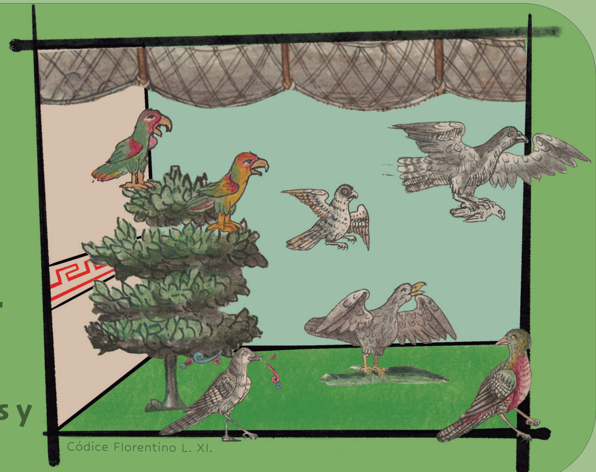
Códice Florentino L. XI.

Había una gran cantidad de serpientes y víboras , las cuales se mantenían en grandes ollas y vasijas de barro.