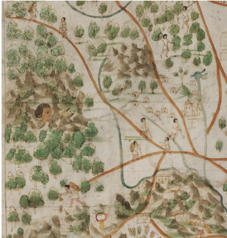
Mapa de México-Tenochtitlan y sus alrededores hacia 1550