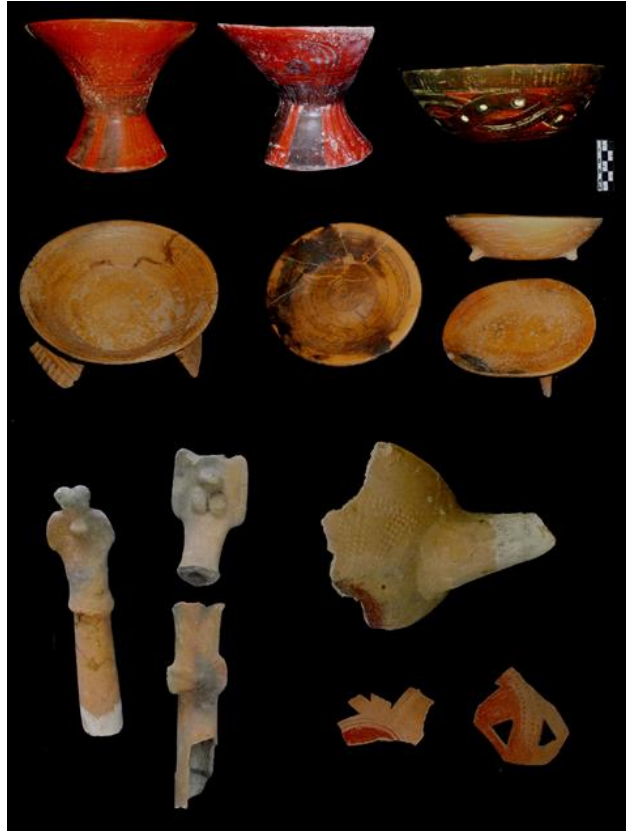
Material Azteca III

* El Seminario se llevará a cabo en la Biblioteca del Sindicato de Investigadores del INAH, Córdoba 45, Col. Roma.